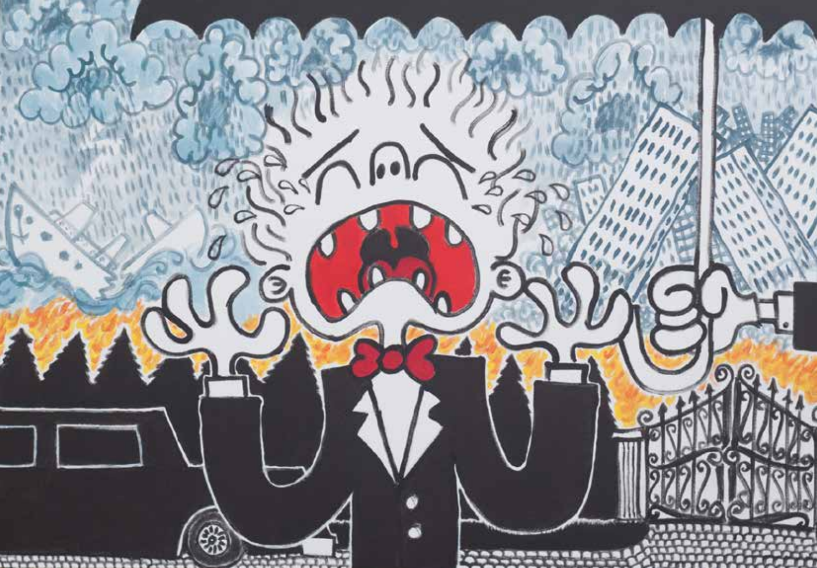
Кутриот мал Рич / Poor Little Rich 100 x 70 см Акрил на платно