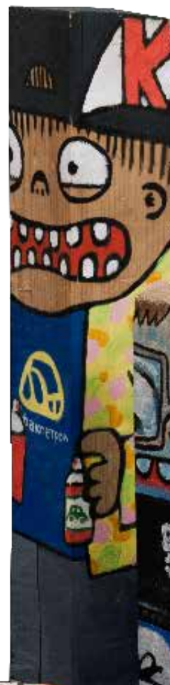
Цртач на графити