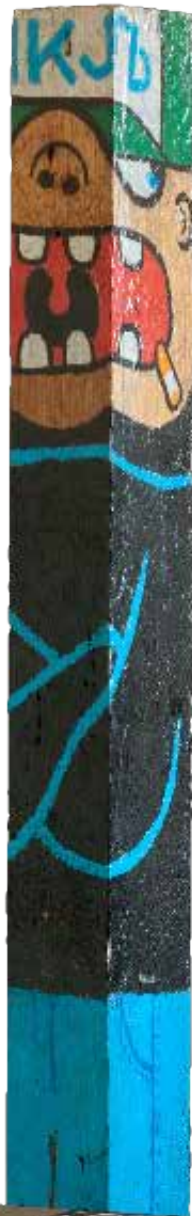
Ликот од право гето